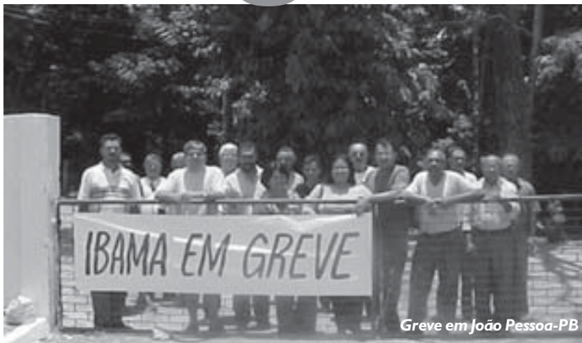
Greve em João Pessoa-PB