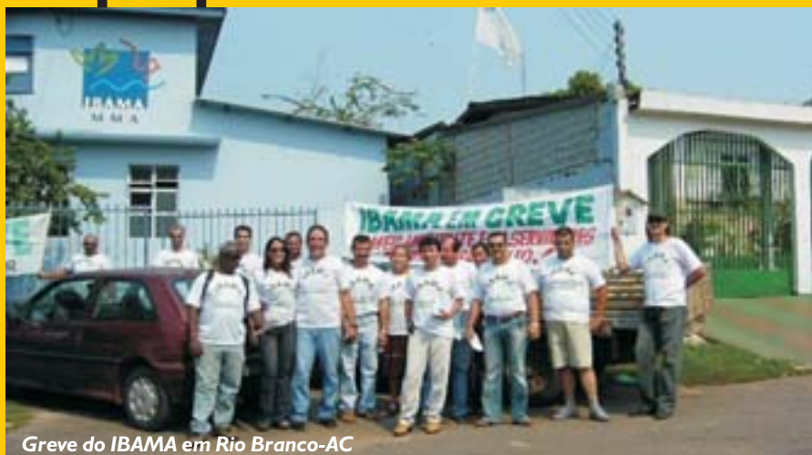
Greve do IBAMA em Rio Branco-AC

N ovamente, diversos servidores de órgãos, como DNIT, IBAMA e Ministério da Fazenda, cruzaram os braços exigindo um Plano de Cargos e Carreiras. A CONDSEF vem tentando aglutinar essas lutas através de uma proposta de diretrizes únicas para os PCCs.